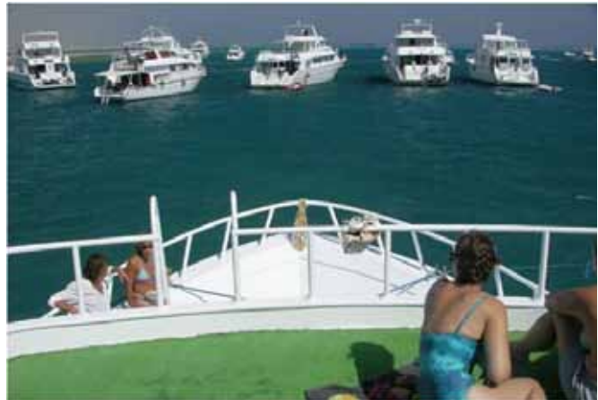
© Ministry of Environment, Nature Conservation Sector