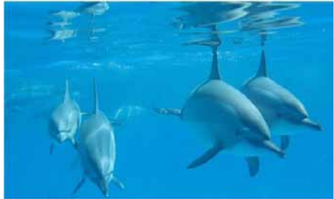
© Ministry of Environment, Nature Conservation Sector

Le cas de Samadai s'est avéré être un modèle idéal appliquant une politique d'éco-tourisme et une stratégie de conservation de la biodiversité et parvient à financer durablement la conservation de la biodiversité à travers la génération de revenus, en utilisant des instruments économiques (taxes d'entrée).