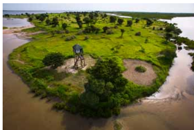
© Jean-François Heltie & Nicolas Van Ingen

L'activité alternative avait été prévue initialement dans le projet de création de l'AMP de Bamboung pour procurer les financements nécessaires à son fonctionnement, compte tenu de la quasi-absence de crédit publics. L'idée était donc, dès l'origine, de développer une activité économique sous la forme d'un écolodge communautaire, dont les excédents d'exploitation, permettraient de financer l'AMP. Le but du campement est donc d'être bénéficiaire pour d'abord assurer le gardiennage de l'AMP, mais aussi constituer une source de revenu pour les employés et la communauté rurale et assurer l'entretien courant de l'AMP.