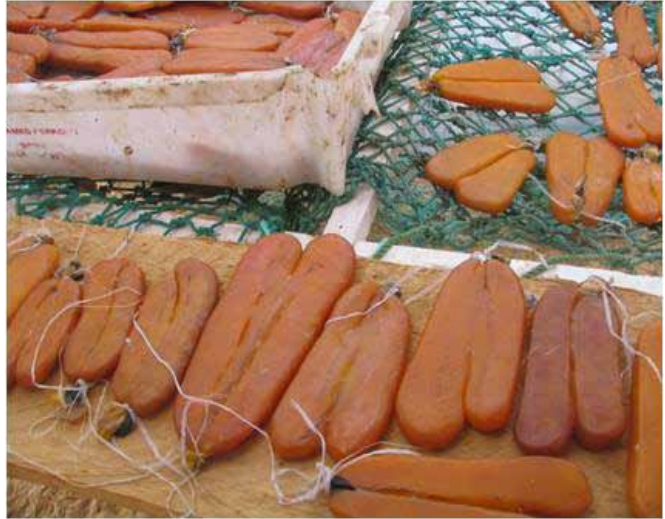
© Parc National du Banc d'Arguin