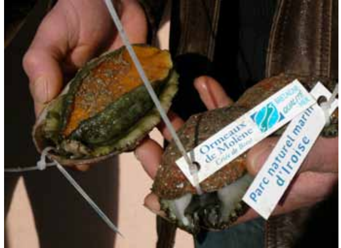
© Agence des Aires Marines Protégées